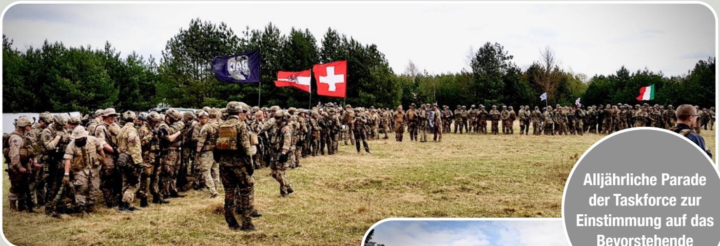
Alljährliche Parade der Taskforce zur Einstimmung auf das Bevorstehende

Wir waren auch heuer wieder mit von der Partie. Vier spannende und lustige Tage in der Wildnis Tschechiens!